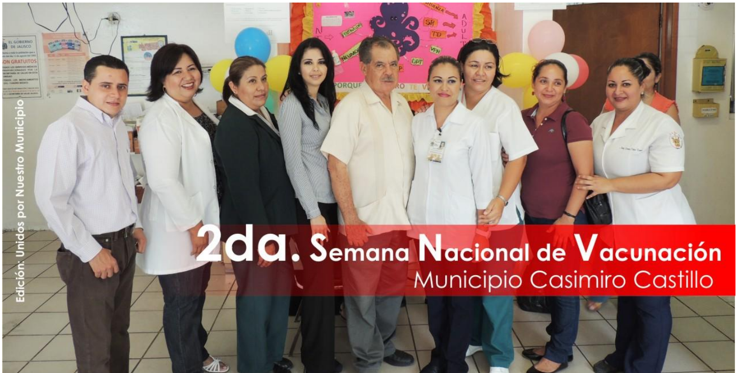
Edición: Unidos por Nuestro Municipio

Durante nuestra administración 2012-2015, nos hemos coordinado con nuestros Centros de Salud, brindando apoyos con vales de gasolina, unidades de aseo público y campañas publicitarias para prevención del dengue, así como para obtención de servicios médicos en las diferentes unidades de salud.